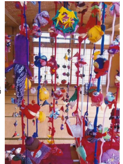
箕輪喫茶での1年間の作品展

③介護など学べる講座：10月24日(木)予定。④ふれあいの会：12月7日(土)に沼南公民館で開催予定。⑤地区懇談会：都合3回開催予定。⑥その他の催し物など：ボランティア講座、世代間交流、料理教室、かわら版「きずな」の発行などを予定。⑦定例事業：ふれあいサロン・ふれあいサロンきずな、喫茶(緑台・箕輪・こかげ・)などは年間を通じて毎月実施。⑧その他：福祉委員会・在宅部会・ボランティア部会などの会議を定期的を実施しています。