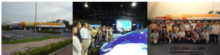
(JAXA筑波宇宙センターにて)