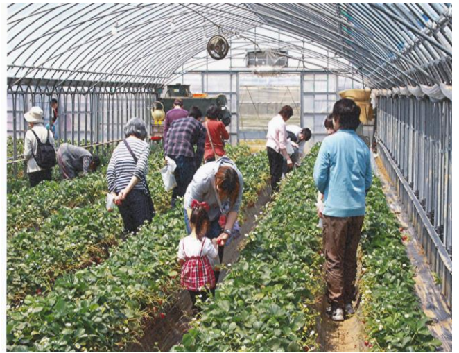
大変好評だったいちご狩り