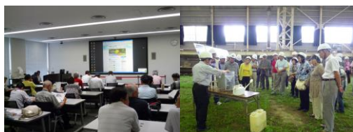
(防災科学技術研究所にて)