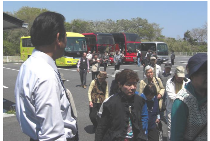
（大好評だった「日帰りバスの旅」）

○「いちご狩り」：4月20日、141名の参加者が集いそのべ農園で実施。もぎたての新鮮ないちごに舌鼓をうち大盛況での一日でした。○「バスの旅」：4月23日、148名が観光バス3台に分乗し大洗の明太子製造工場を見学後、海鮮料理を堪能し午後はアクアワールド水族館を見学。那珂湊の魚市場などでお土産を仕入れ無事帰着。○「第7回大津川歩こうかい」：5月11日、参加者50名が大津川土手に集合し軽く体操を行い、健脚組と亀さん組に分かれて、約2時間で5kmを歩き、トン汁を食べ無事終了。○「総会」：6月14日、桐友学園で25年度の事業・決算報告承認と26年度の事業計画・予算案を議決。年々助成金が減少するなど自主財源の確保が急務。○「福祉委員会」：6月21日、活動計画等を審議。今年度は71名での運営を予定。○「今後の予定」：①敬老訪問：敬老月間に合わせて記念品をお届けし長寿をお祝いする。②地区懇談会：9・11月の2回予定。③大津川歩こうかい：次回は11月23日予定。④ふれあいの会：12月14日予定。⑤その他：友愛訪問のほか各種サロンは毎月実施しています。（副会長 室井 三千代）